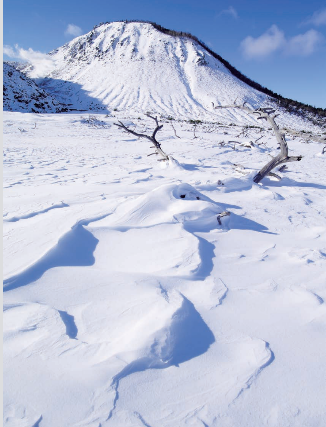
PENTAX 645D+SMC PENTAX-D FA645 25mmF4AL[IF] SDM AW 絞り:F14 / シャッタースピード:1/320秒 / 感度:ISO400 / ホワイトバランス:CTE / カスタムイメージ:リバーサルフィルム