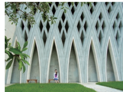
f=28mm 1/310 秒 F3.5 ISO100 EV+0.3 WB; 多画面 自动

高倍放大（10.7 倍）28-300mm 变焦，几乎可以随心所欲地将任何拍摄对象纳入镜头中，从绚丽的风景到灿烂的笑脸，全部手到擒来。