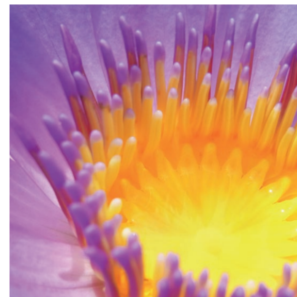
f=70mm 1/1070 秒 F4.5 ISO100 EV+0 WB; 多画面 自动

此选项让您轻松体验各种创意效果。可选择包括“柔焦”、“正片负冲”、“玩具相机”和“微型化”在内的 6 种不同模式，只需按下快门释放按钮，即可获得与众不同的效果。