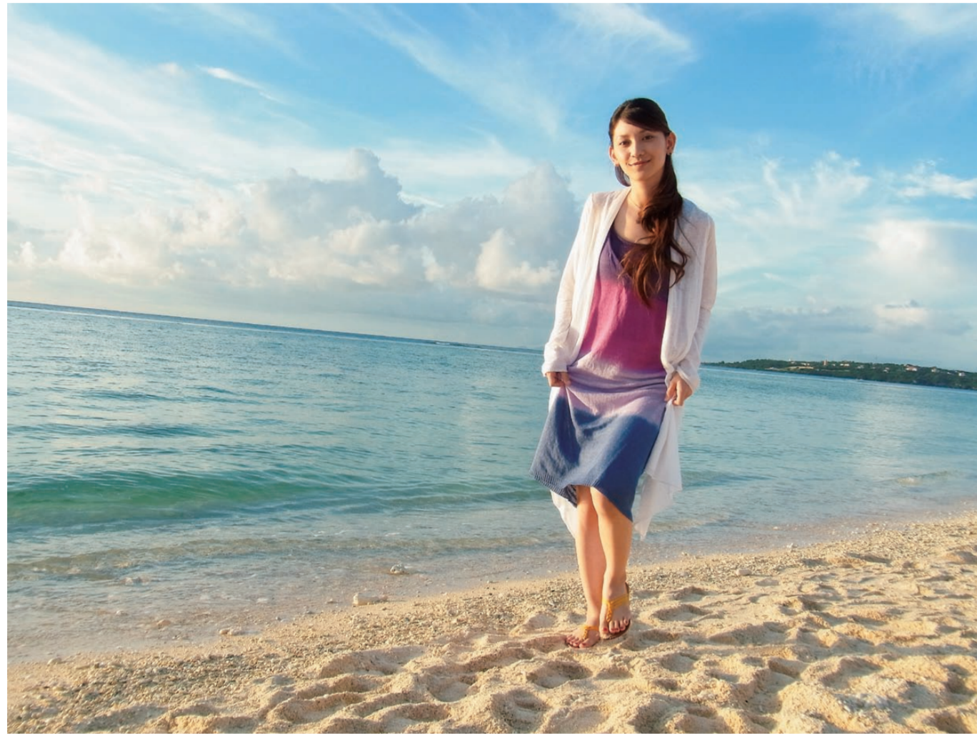
f=35mm 1/380 秒 F4.0 ISO100 EV+0.3 WB; 多画面 自动 对象追踪自动对焦