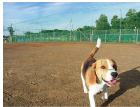
对象追踪自动对焦