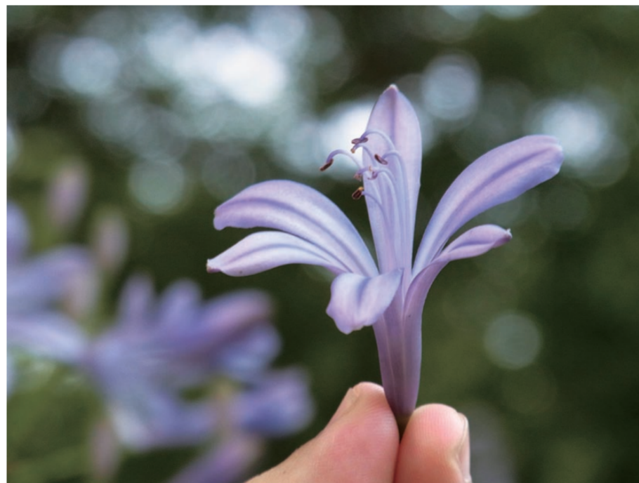
f=200mm 1/23 秒 F4.5 ISO200 EV+0 WB; 多画面 自动